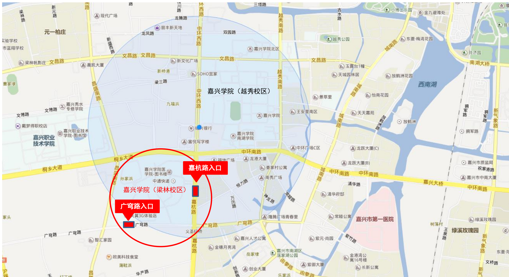
附件 3 嘉兴学院梁林校区在嘉兴市的地理位置